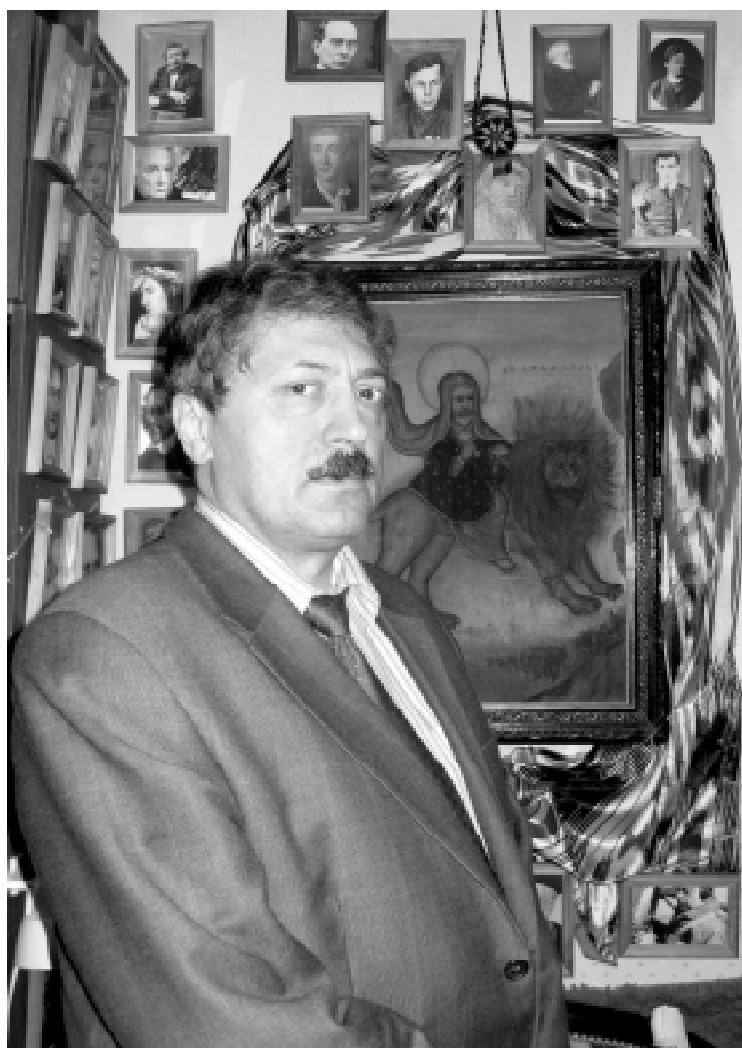
Сергей Лукницкий дома, 6 февраля 2008 г.