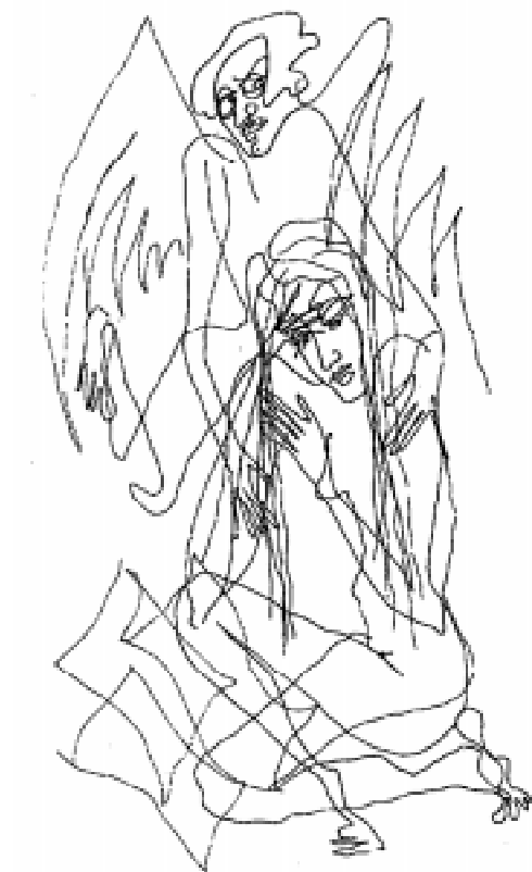
Ранние стихи, 1970-е